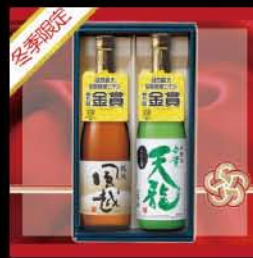
風越・天龍 爛酒金賞受賞セット