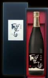
大吟醸 聖岳 (ひじりだけ)