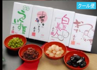
春月 限定4種セット②

●内容 / おたふく豆250g・黒豆220g うぐいす豆250g・ひよこ豆250g