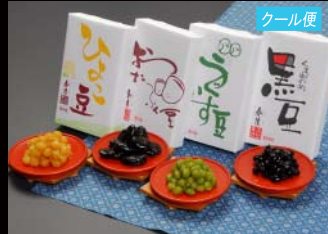
春月 限定4種セット①